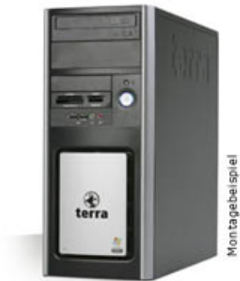
Maße (HxBxT): 436x181x430 mm